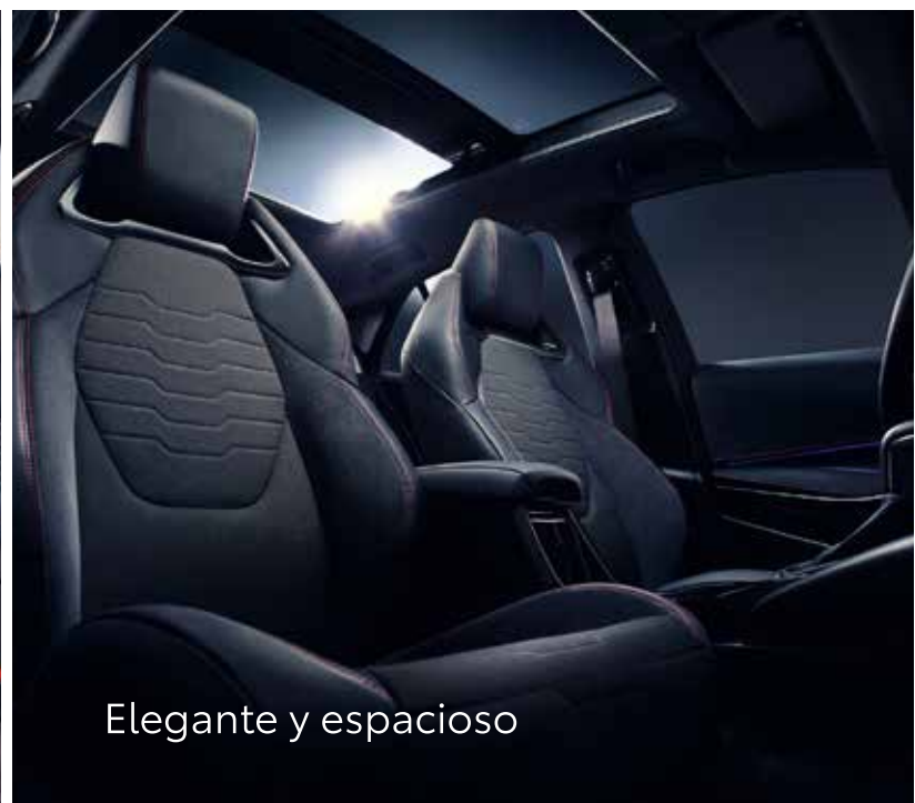
Elegante y espacioso