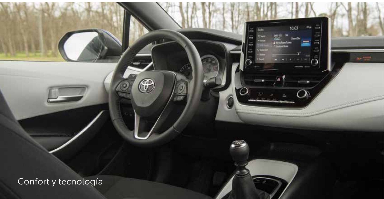
Confort y tecnología