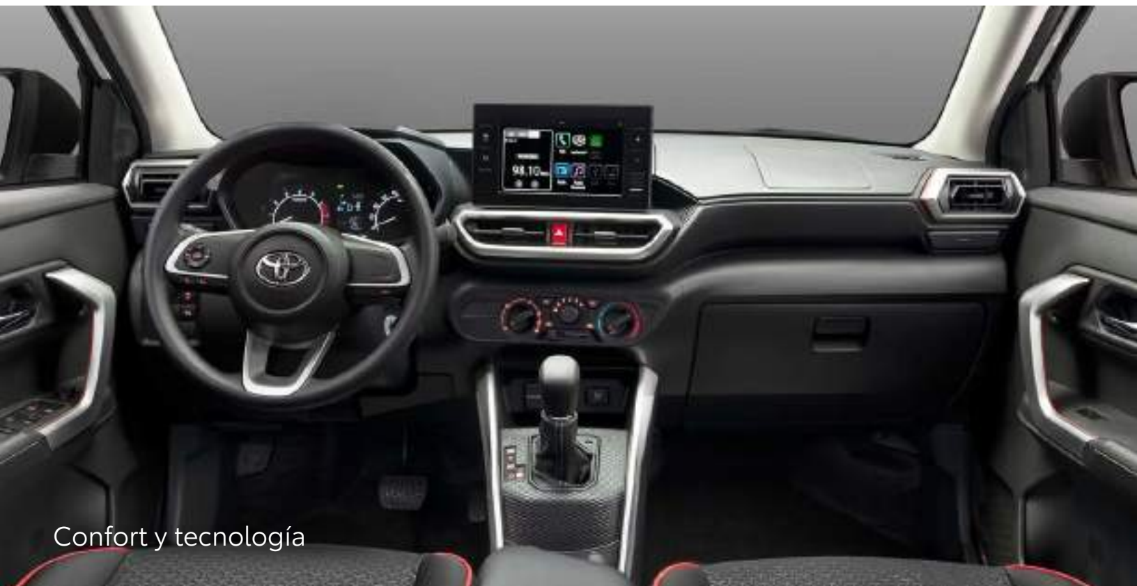
Confort y tecnología