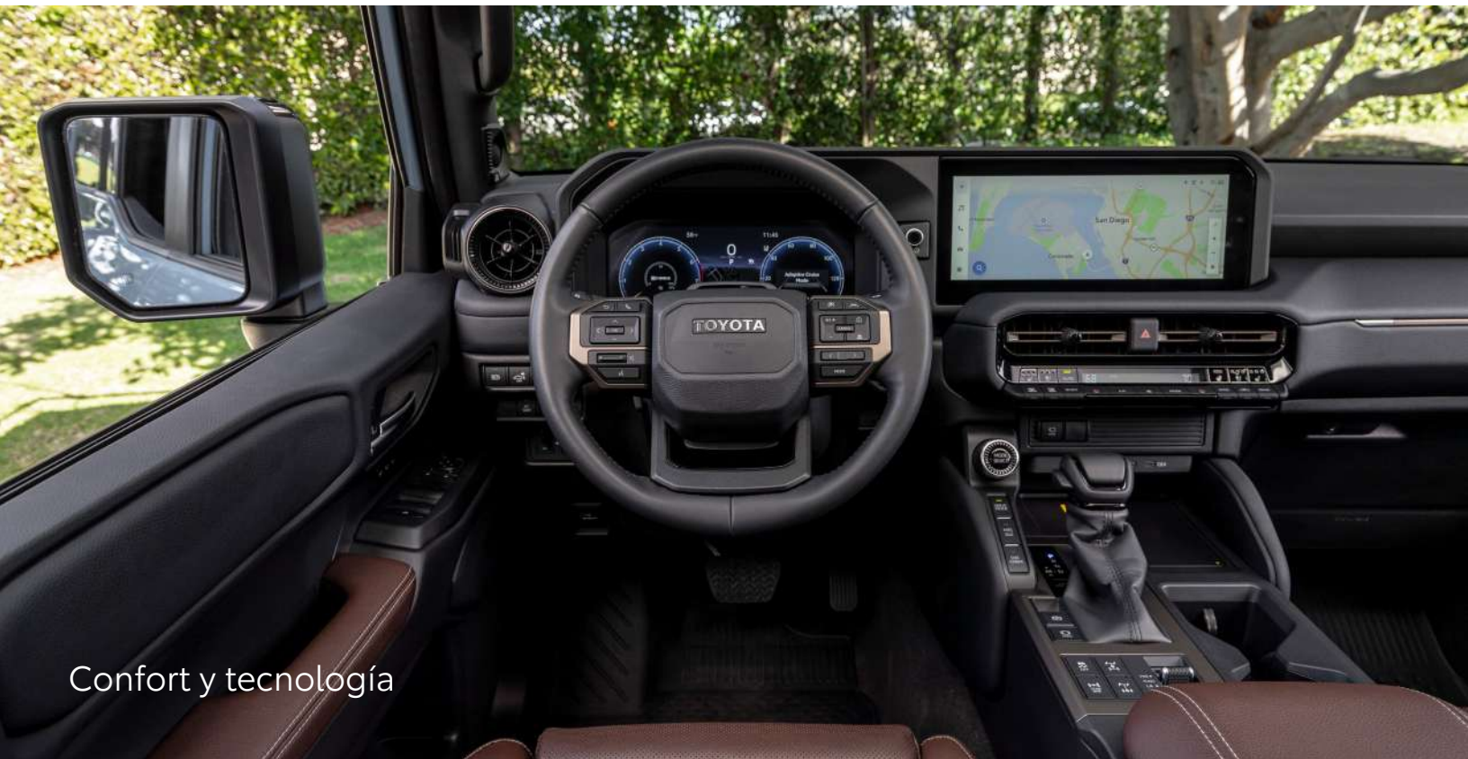
Confort y tecnología