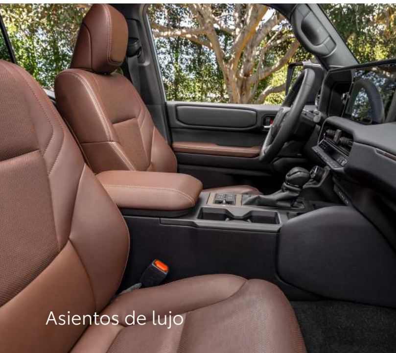
Asientos de lujo