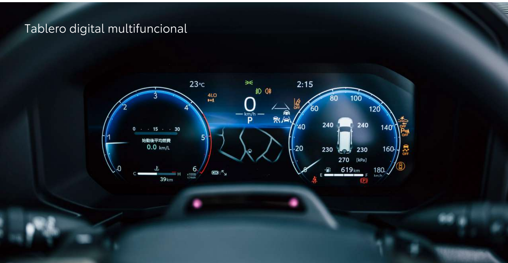
Tablero digital multifuncional